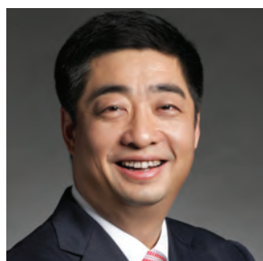
胡厚崑 華為技術(ファーウェイ) 副会長 兼 輪番会長 Ken Hu Deputy Chairman, Rotating Chairman Huawei Technologies