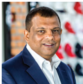
トニー・フェルナンデス エアアジア・グループ CEO Tony Fernandes CEO AirAsia Group