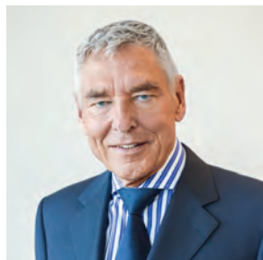
ピーター・ブラベック・レッツマツ ネスレ 名誉会長 Peter Brabeck-Letmathe Chairman Emeritus Nestlé